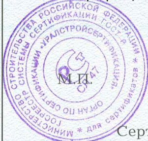
Схема сертификации З.